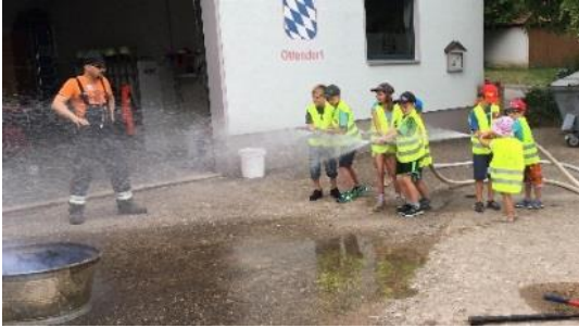
Ein echtes Feuer Löschen! ←