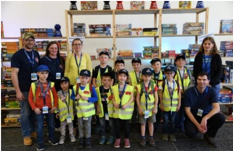
Besuch der „Eberner Spieletage“ ↑