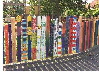
72-Stunden-Aktion ↑ Eishalle in Haßfurt ↓